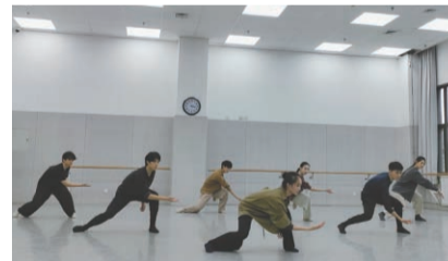
责任编辑 王渊博 胡一飞