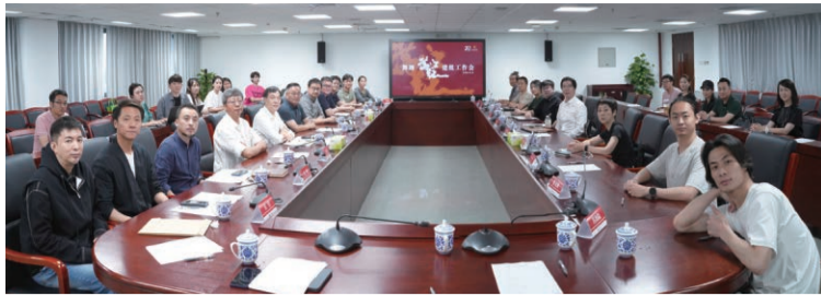
年9月9日，学院正式聘请张艺谋导演为荣誉教授，是学院人才强校战略中的重要举措，让师生能够跟世界顶级艺术大师有更近距离地接触，接受更高层次的艺术熏陶。

长久以来，张艺谋导演与学院保持着密切的联系，在艺术创作实践与人才培养方面提供了有力支持和宝贵指导。在研发创作同名舞剧《满江红》以来，巴图书记高度重视、亲自指挥，许锐院长率领核心创作团队多次拜访张艺谋导演工作室，就作品创作理念、剧本架构、舞蹈编排以及舞台视觉等关键要素展开了深入的学习、交流和探讨。此次，张导演将电影《满江红》的舞蹈教学改编版权无偿授予学院，为学院乘势而上，探索艺术领域的险绝之处，把握跨艺术门类创作的发展趋势，提供了新思路、打开了新格局、指明了新方向。