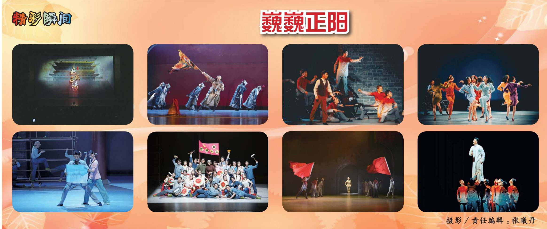
摄影 / 责任编辑：张曦丹