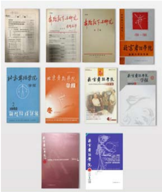
《北京舞蹈学院学报》封面历史沿革

舞蹈学研究相较于其他人文社会学科的研究起步较晚，比如音乐学、美术学。事实上，将难以言表的舞蹈身心运动规律、情感表达、审美意蕴文字化，似乎与舞蹈的本质和规律存在悖论。因为舞蹈是在文字诗歌和音乐之上的情感表达方式，是对“言之不足”的超越。因此，对舞蹈的研究并将研究成果文字化客观上有一定的难度。但中国舞蹈人在舞蹈学校教育开创的初期就开始了艰苦的舞蹈研究工作。应该说，最早的舞蹈研究发端于舞蹈专业教学和人才培养的现实需求。如何将传统口传身授的身体教学转向科学化、系统化、规模化的科班教育，首先应是教学大纲的研制、教材的研发和教师的培养。中国艺术研究院舞蹈研究所的设立为舞蹈科学研究的专业机构，集中人力、聚焦专题、集体攻关的研究方式，直接推动了《中国舞蹈史》多卷本的研究与成果出版。