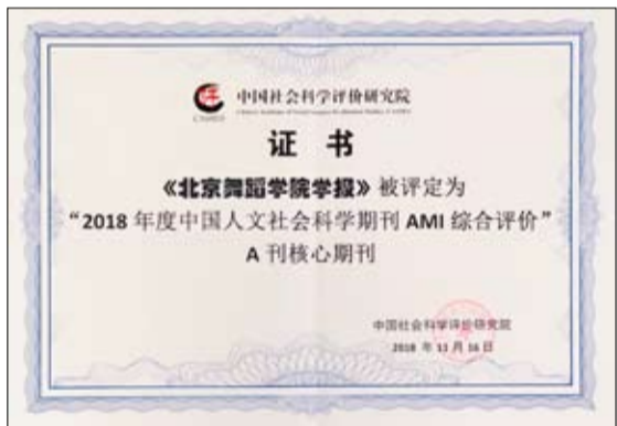
《北京舞蹈学院学报》被评定为“2018年度中国人文社会科学期刊AMI综合评价”A刊核心期刊

北京舞蹈学院于1984年成立了科学研究处，着手研究改善舞蹈学院的招生、培养机制以及缓解职业病等急需解决的课题。于1985年创办了院刊《舞蹈教育与研究》，即目前《北京舞蹈学院学报》的前身，其于1997年公开发行。该刊现在成为全国中文核心期刊、中国人文社会科学核心期刊、中国社会科学院引文索引CSSCI来源期刊、RCCSE中国核心学术期刊、人大复印报刊资料重要转载来源期刊、中国社会科学院AMI评价体系A刊核心期刊。《北京舞蹈学院学报》常设舞蹈理论研究、舞蹈史研究、舞蹈创作研究、舞蹈教育研究、舞蹈文化研究等栏目，遵循舞蹈学知识谱系和舞蹈学学科构成设置栏目，是舞蹈科学研究的重要载体和窗口，舞蹈学术人才成长的百花园。舞蹈学术刊物的创办有效推动了舞蹈教育从业者将教育教学经验总结提升为教育规律，从感性教育上升到理性认识，丰富了舞蹈学学科知识体系内涵，成为中国舞蹈教育研究的重要学术阵地。从中国知网搜索结果来看，从1992年到2018年文章截稿时为止，《北京舞蹈学院学报》共刊载2635篇文章，其中一半以上由北京舞蹈学院的作者著成。文献量从上世纪90年代初的年均几十篇到现在的几百篇，成倍增长，研究专题围绕舞蹈作品、舞蹈历史、中国古典舞、中国民族民间舞、芭蕾舞、舞蹈评论、舞蹈教育、舞蹈文化等展开。