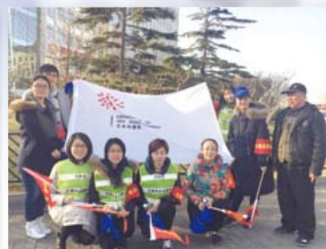
人文学院艺术传播系