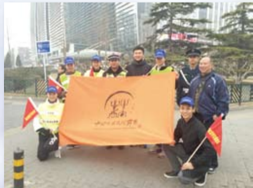
中国民族民间舞系