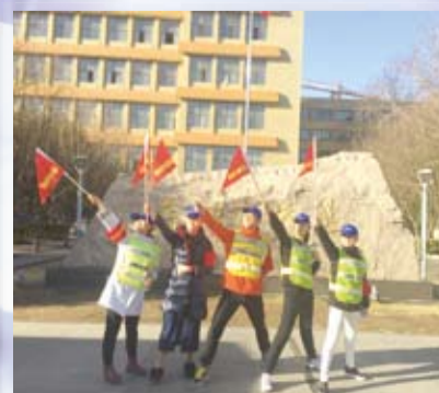
人文学院舞蹈学系