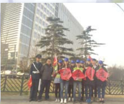
创意学院艺术设计系