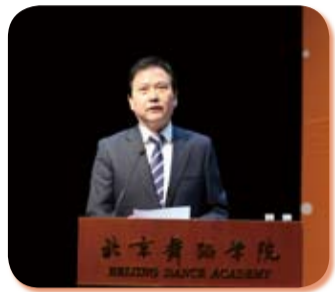
北京市教育委员会副主任黄侃致辞

2018年10月27日，国际舞蹈教育论坛暨中国舞蹈高等教育40周年主题研讨会在北京舞蹈学院召开。本次论坛是2018北京国际舞蹈院校芭蕾舞邀请赛的系列活动之一，由北京舞蹈学院主办，人文学院与教育学院共同承办，国际合作与交流处支持，邀请国内外知名舞蹈教育学者约20余位，围绕“新时代面向未来的舞蹈高等教育”主题，在人才培养、科学研究、社会服务、文化传承创新、国际交流合作等方面进行了深入的研讨和交流，旨在集思广益、强化学术交流，推进中国及世界舞蹈高等教育事业发展。本刊集中呈现参会者发言摘要，以飨读者。