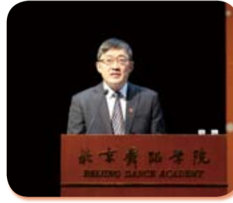
北京舞蹈学院党委书记王旭东致辞